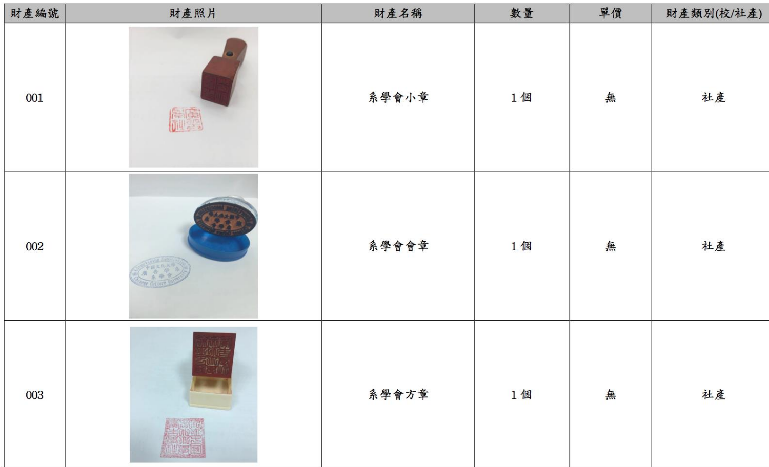
105 學年度社團財物登記表-社產